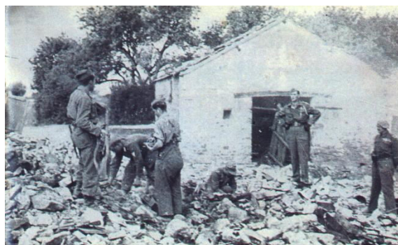
La Brosse au lendemain de l'explosion du 12 mai 1945

Le conseil municipal de Saint-Viaud, lorsqu'il avait découvert cette histoire en 2015, 70 ans après, l'avait fait citoyen d'honneur pour ce geste admirable et très fort.